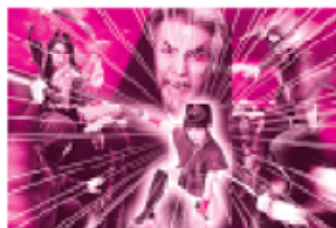
「사무라이 쇼」 이미지 사진입니다.

■ 「사무라이 쇼」 토우에이 교토의 스타팀이 빅 액션의 액션을 연기합니다. (출연: 사사도 다이켄 역선 군단 또는 토우에이 연기자) (무료) 경우에 따라서는 중지될 수 있습니다.