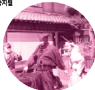
「영화의 비밀 거짓·진짜」

■ 로케이션스튜디오 「영화의 비밀 거짓·진짜」 영화촬영의 트릭이나 속임수를 핵심해 가면서 재미있게 보여주는 영화학관입니다. (출연= 토우에이 연기자)(무료)